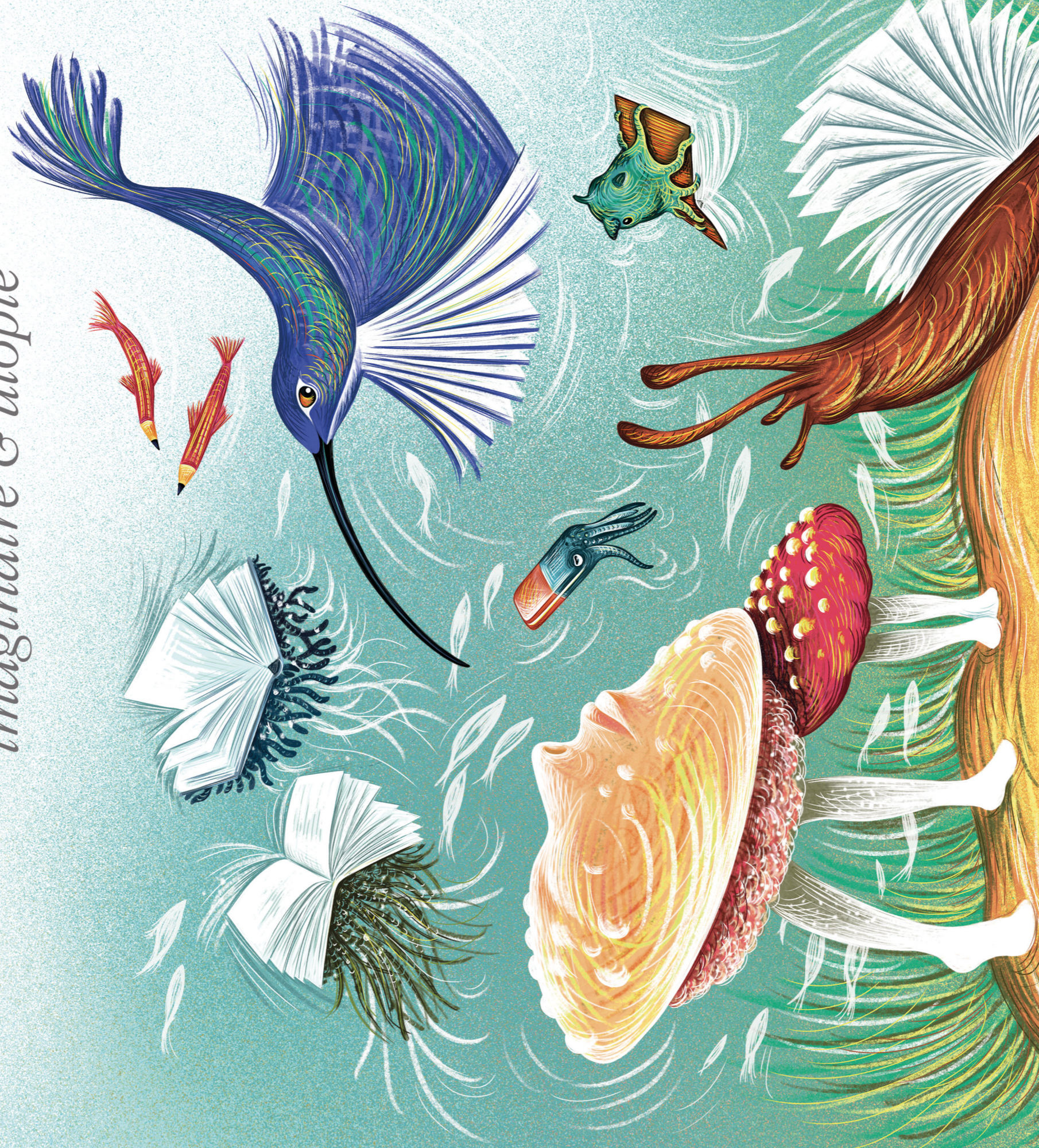
Illustration : Isabelle Simler